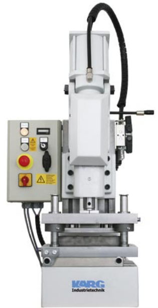
Pneumatische Probekörperstanze für Aluproben