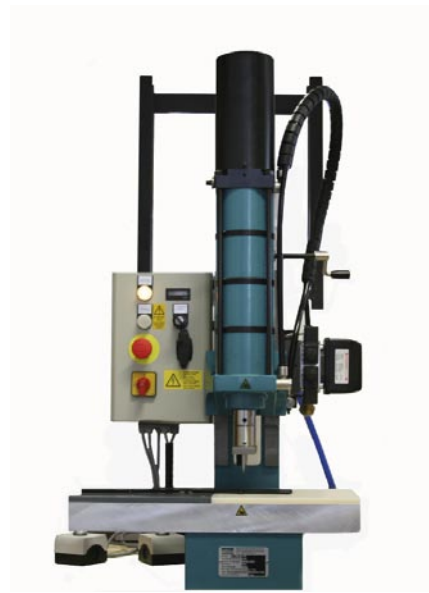
Pneumatische Probekörperstanze / Angußstanze